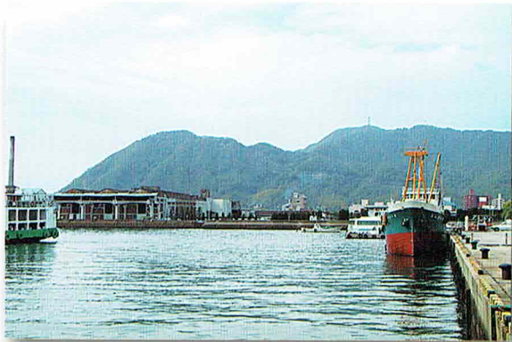
■三原港より筆影山(左)と竜王山(右)を望む