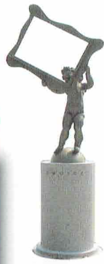
「OMOIDE」 2001年 高橋秀幸制作