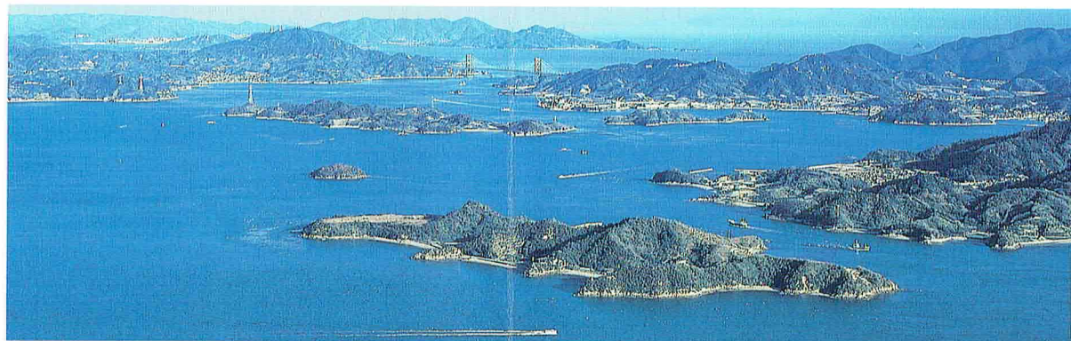
■瀬戸内海随一といわれる多島美

三原駅に降り立ち、潮の香りのする南へ5分ほど歩くと、そこはもう三原港。まぶしい瀬戸内の青い海と干拓地の工場の向こうに明るい緑の山が見えます。この山が標高311mの筆影山(須波町)です。